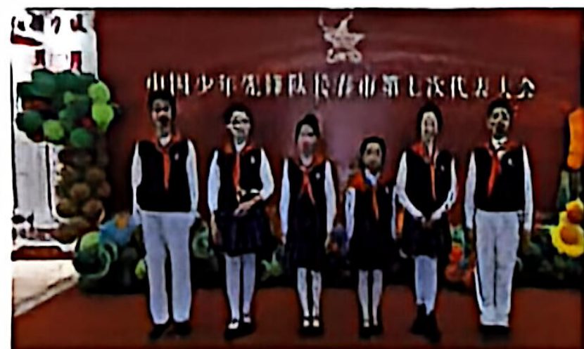
少先队员参加中国少年先锋队长春市第七次代表大会