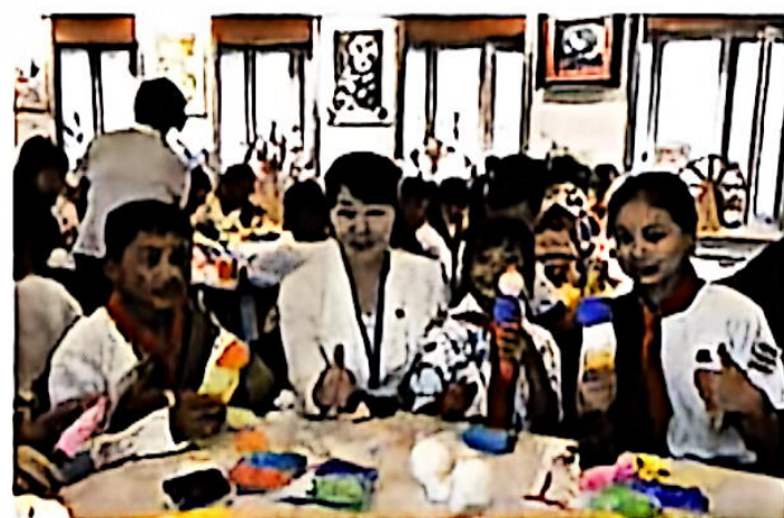
西藏日喀则市师生访校活动