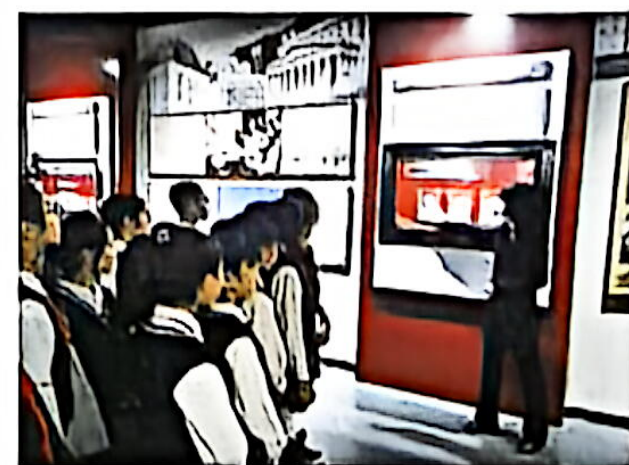
学生走进吉林省检察院参观学习