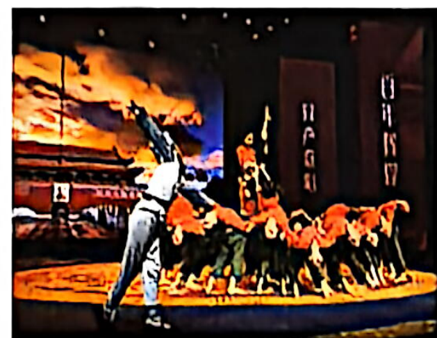
舞蹈队参加朝阳区“阳光杯”比赛