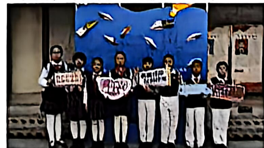
吉林省少年儿童辩论队荣获“特金奖”