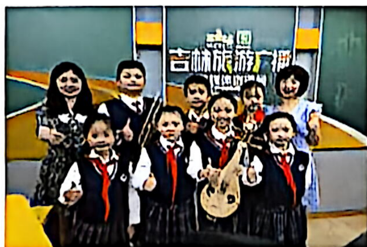
“红领巾看长春”参加广播电台活动