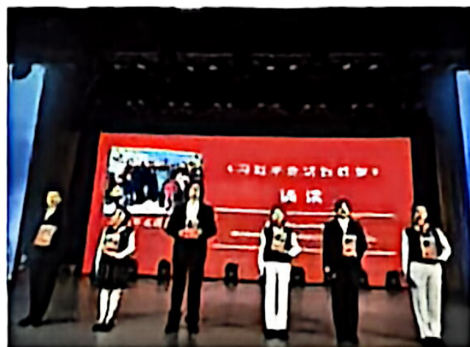
“书香飘万家 网启新征程”吉林省家庭亲子阅读活动启动仪式