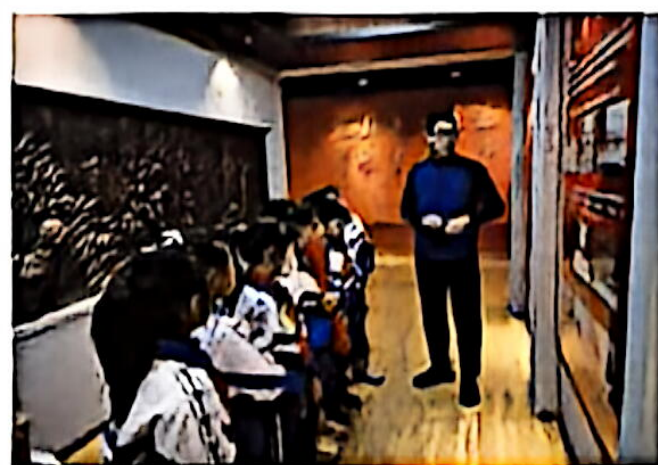
参观消防队社会实践活动

学校的德育工作不断传承、创新和发展，全力推进德育科研和成果转化工作。各项德育活动多次被电视、报纸、新媒体等各级各类媒体报道。学校将在实践中不断探索完善，形成德育工作长效方略，关注、引导、教育、培养“解放”学子立足家乡、胸怀祖国、放眼世界，用温度与厚度、深度与广度，打造德育工作新格局，谱写“解放教育”新篇章！