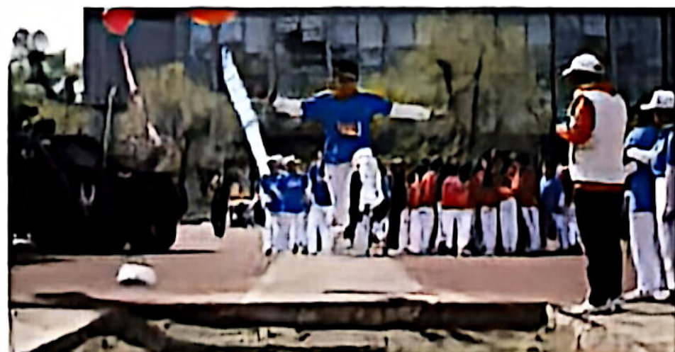
体育科技艺术节之体育比赛掠影