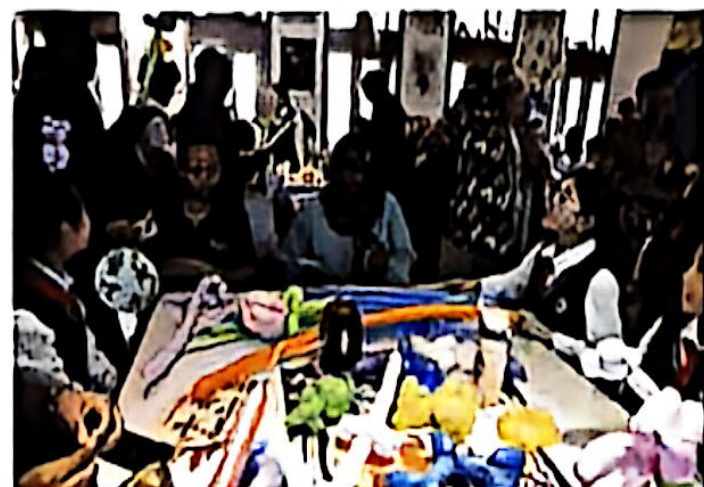
“一带一路”共建国家留学生访校并参加学生社团活动